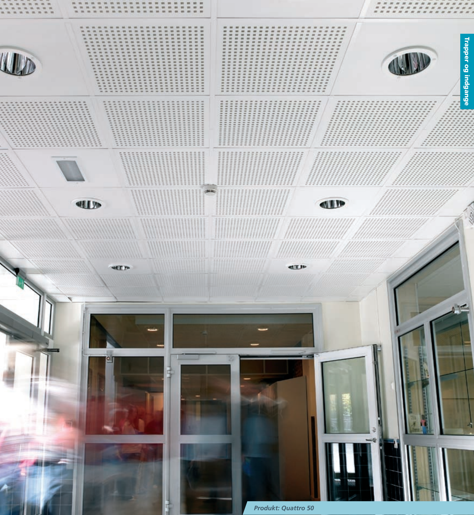
Produkt: Quattro 50