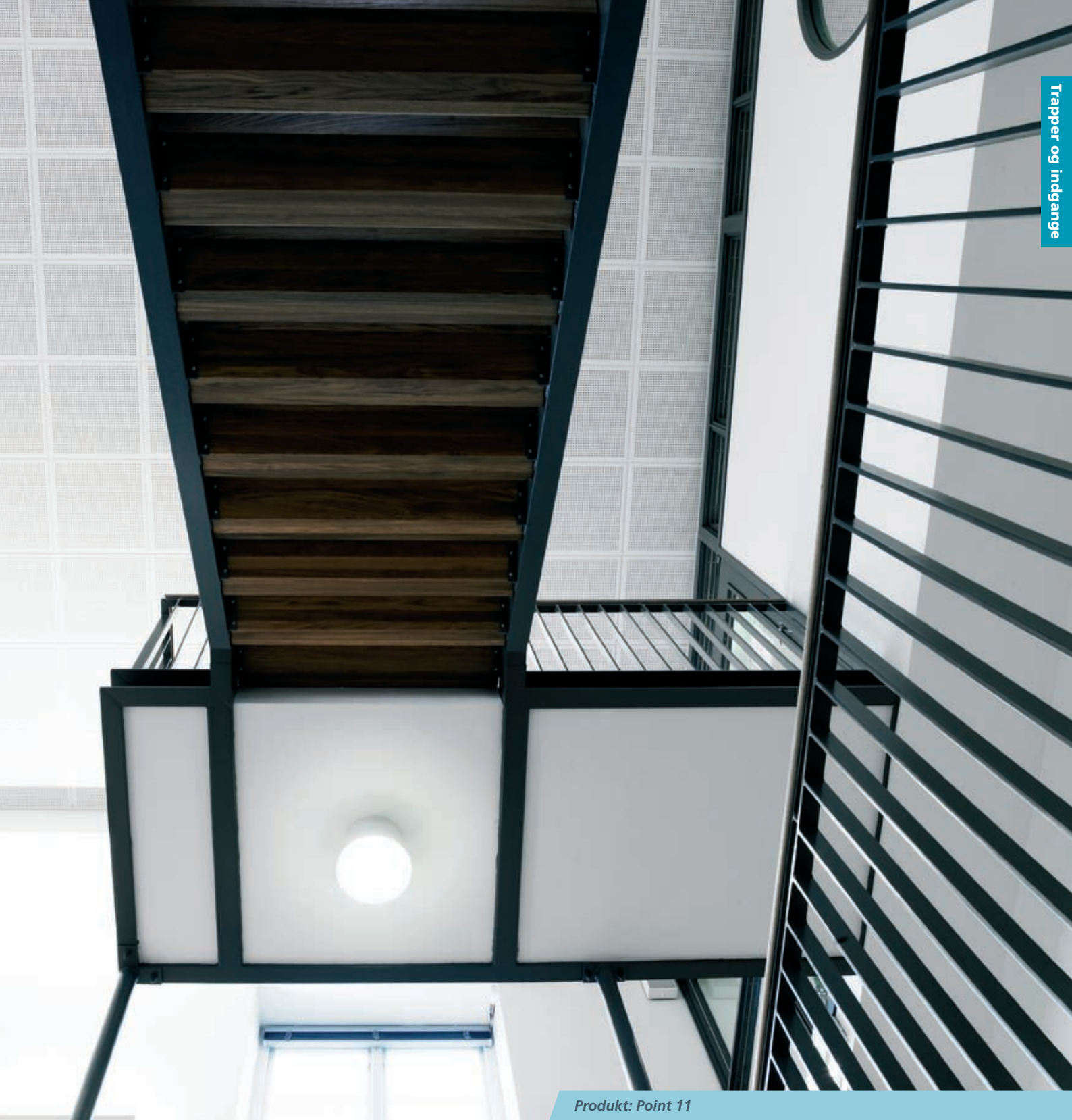
Produkt: Point 11